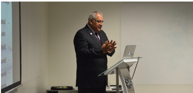
Presentación del Contralmirante (R) Carlos Tello

Una explosión ocurrida la tarde del martes 22 de abril de 1997 cambió la historia del país. Aquel día, bravos comandos dieron la muestra más grande de desprendimiento al arriesgar su propia vida por la de un grupo de ciudadanos que no conocían. Ellos derrotaron al terrorismo que amenazaba a los rehenes y, en realidad, a todo el Perú.