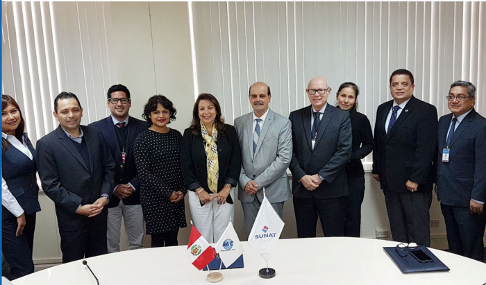
Funcionarios de la SUNAT y directivos de BASC PERÚ.